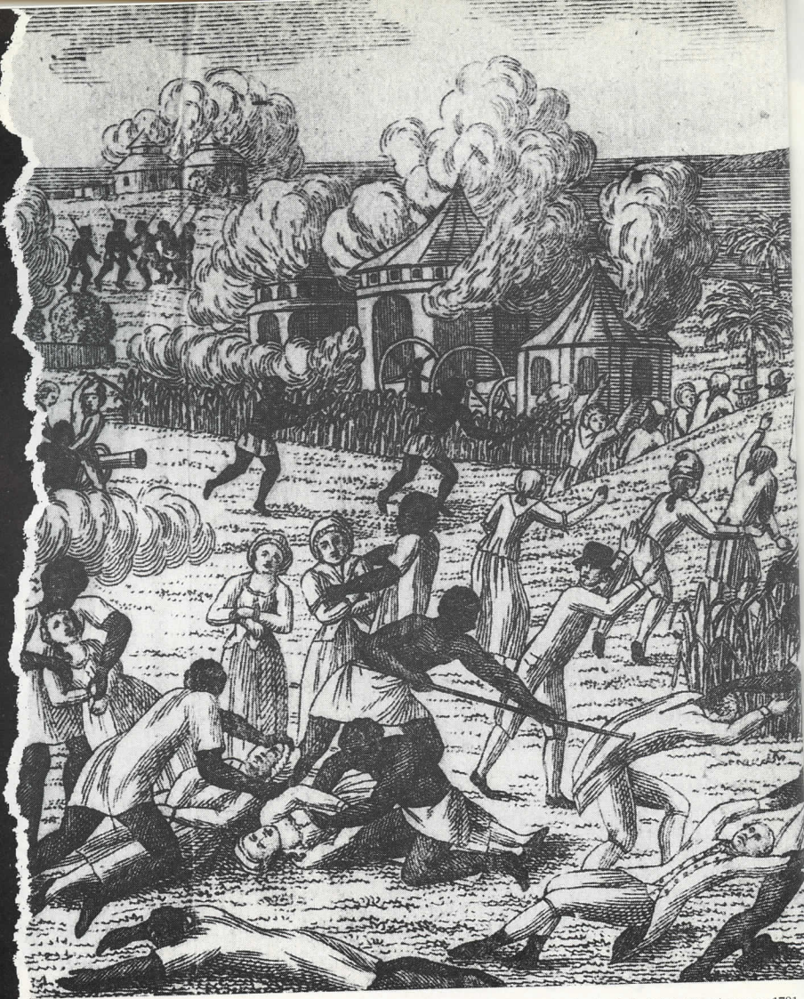
Révolte des Noirs à Saint-Domingue en 1791