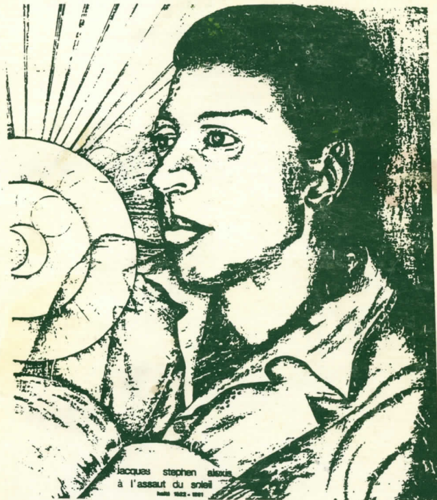
Jacques Stephen Alexis à l'assaut du soleil 1922 - 1931

JACQUES STÉPHEN ALEXIS COMBATTANT ET ROMANCIER D'AVANT - GARDE OU L'HUMANISME DE JACQUES STEPHEN